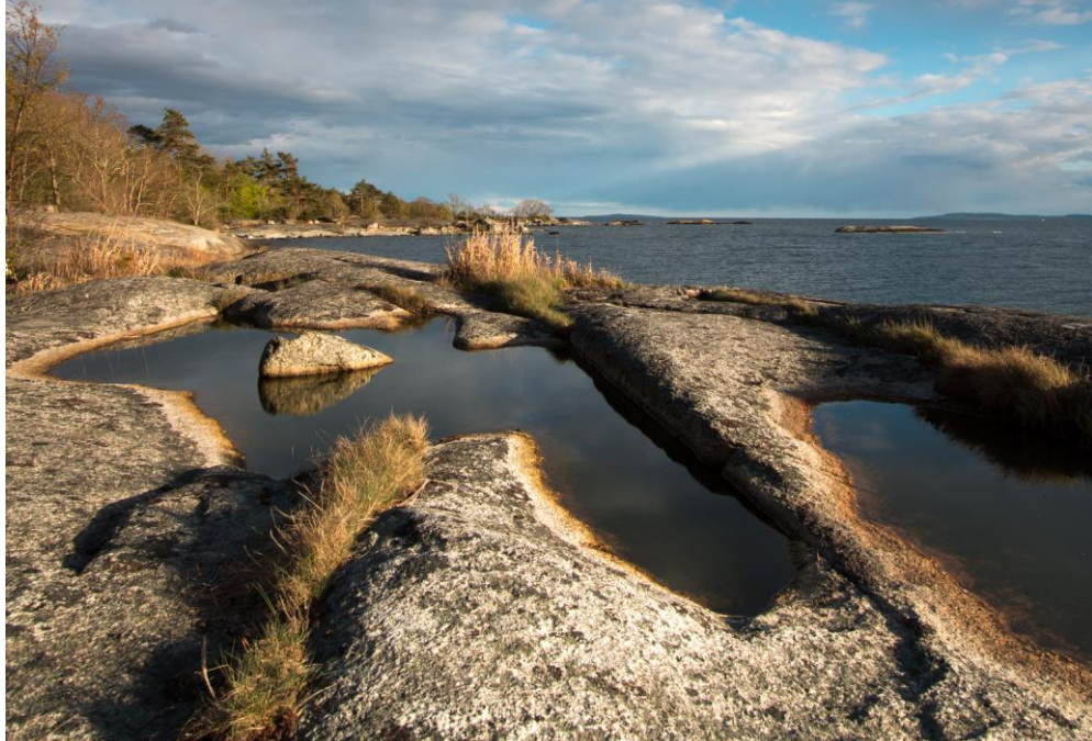
Fler bilder från Sternö