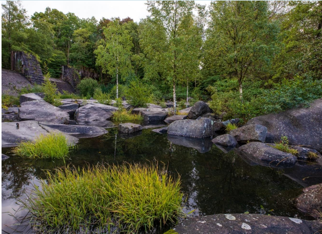
Döda fallet, Yngeredsfors