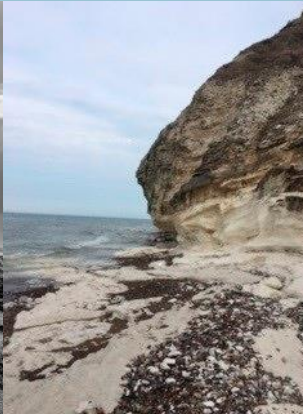
Bulbjerg och tretåig mås