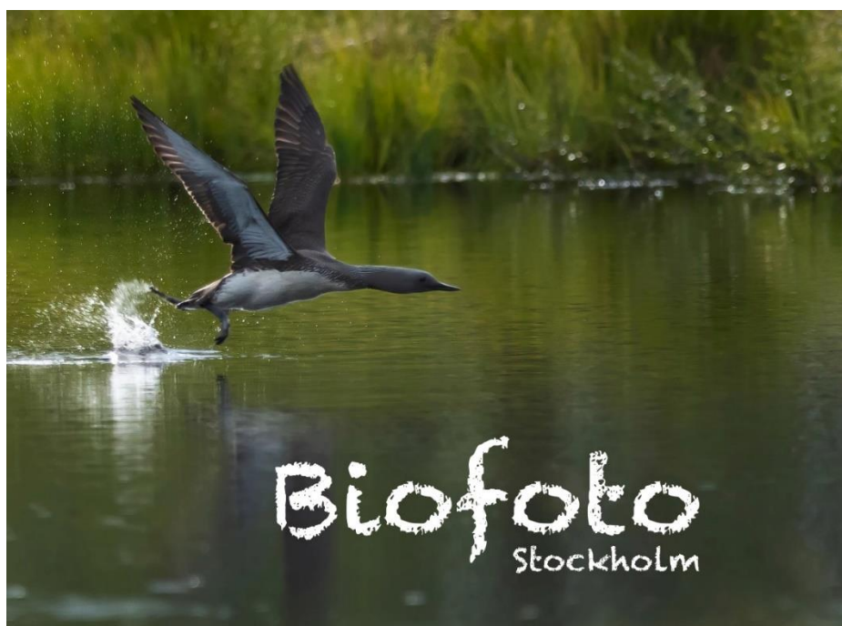
Omslaget till BioFoto Stockholms fotobok