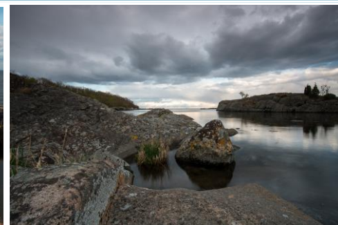
Bilder från Sternö