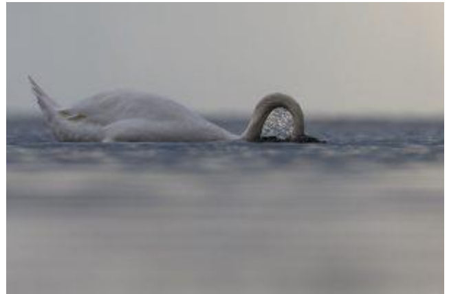
Frode Wendelbo, BF Väst, 26 poäng