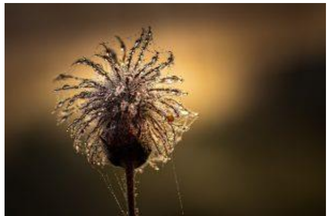
Tommy Lie, BF Norr, 26 poäng