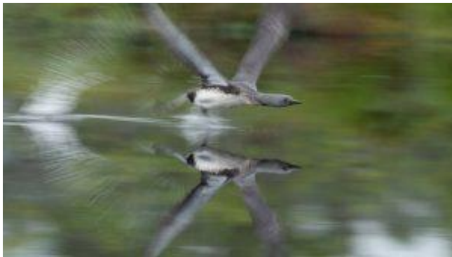
Karl-Evert Eklund, BF Bergslagen, 28 poäng