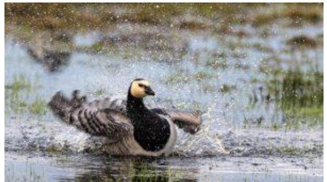
Mats Stafström, BF Syd, 26 poäng