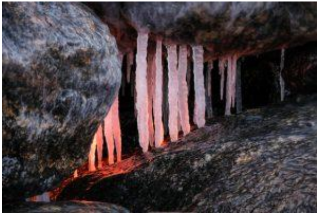
Eva Liedgren, BF Norr, 26 poäng