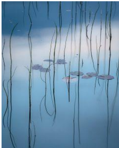
Karl Wetterlund, BF Norr, 26 poäng