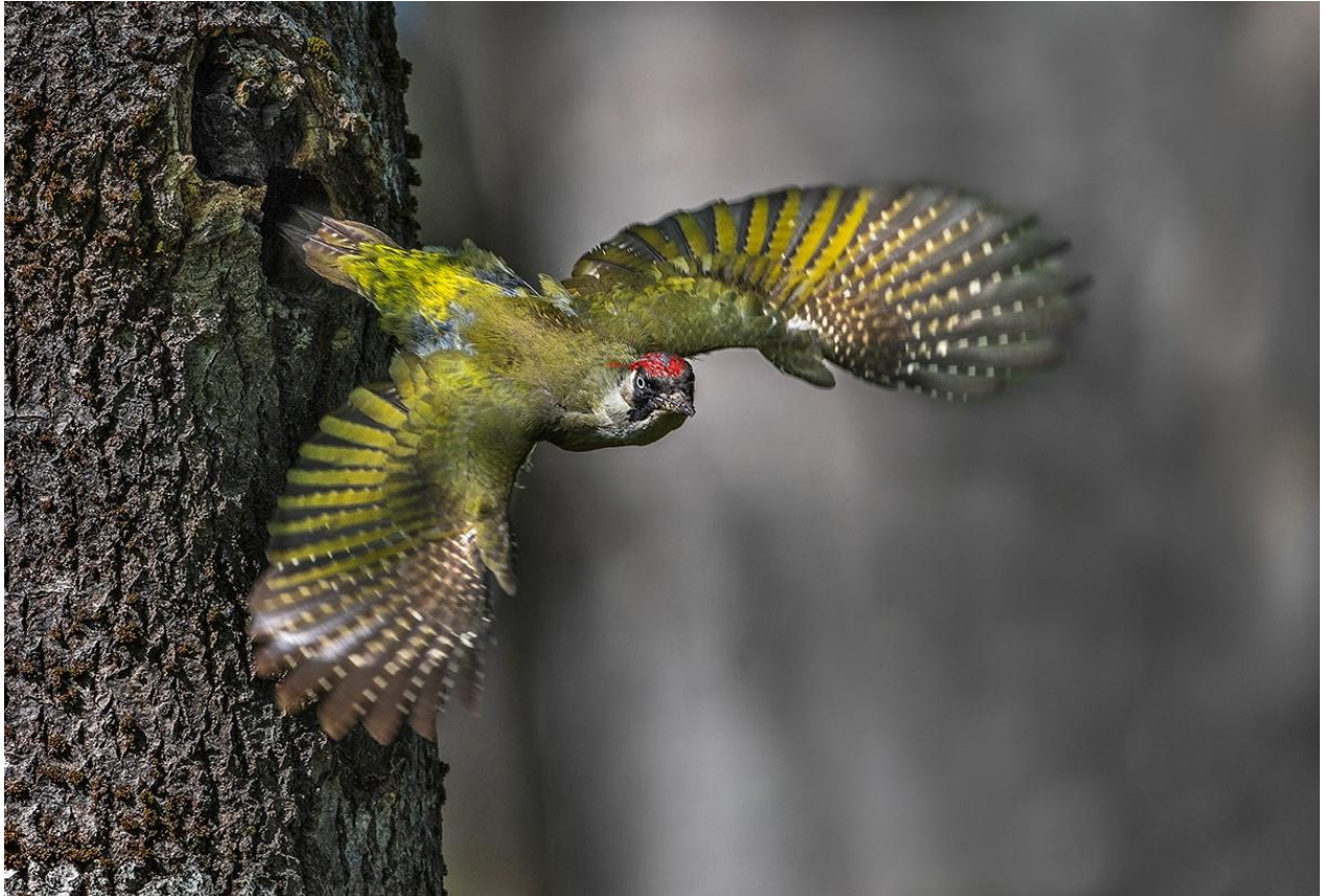
Vinnarbild i BioFoto:s fototävling 2022