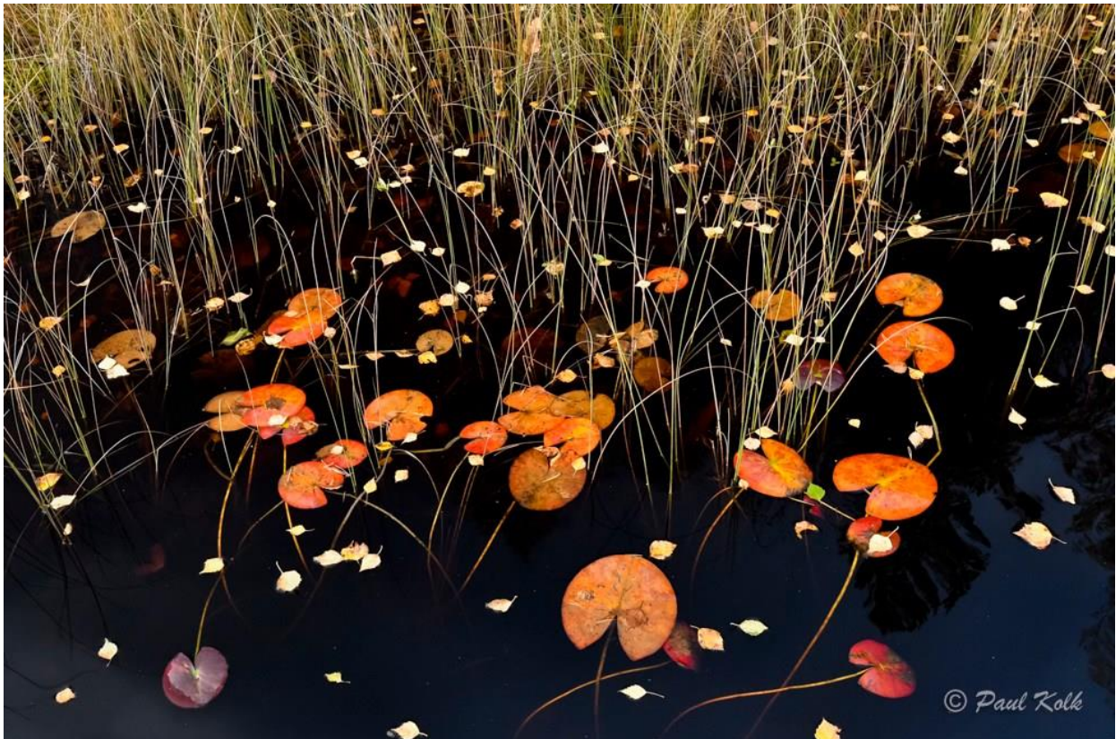
Hösten har kommit till tjärnen! De vita näckrosbladen har fått höstfärger. Nära Hofors, Gästrikland