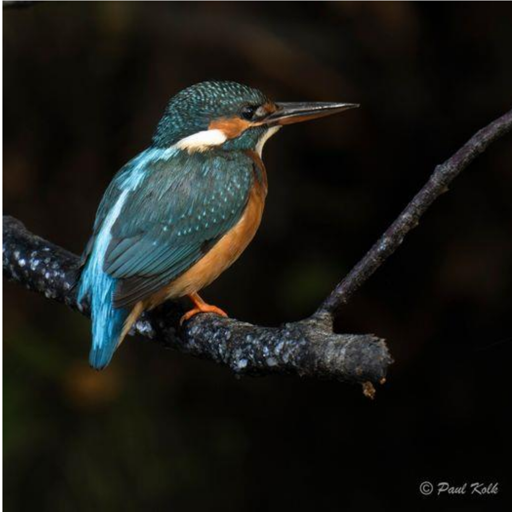
Ett möte med den lille blå vid Dalälven